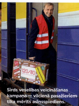
Sirds veselības veicināšanas kampaņa — vilcienā pasažieriem tika mērīts asinsspiediens.