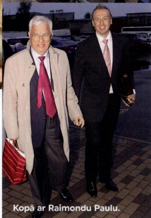
Kopā ar Raimundu Paulu.